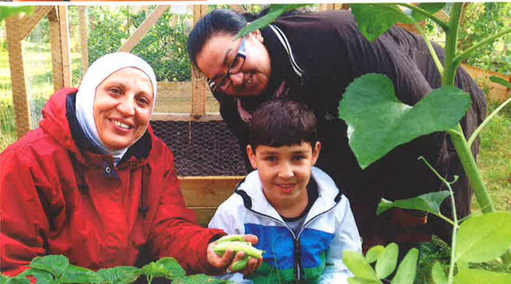
Arbeidet gir resultater i parsellhagene på Romsås.