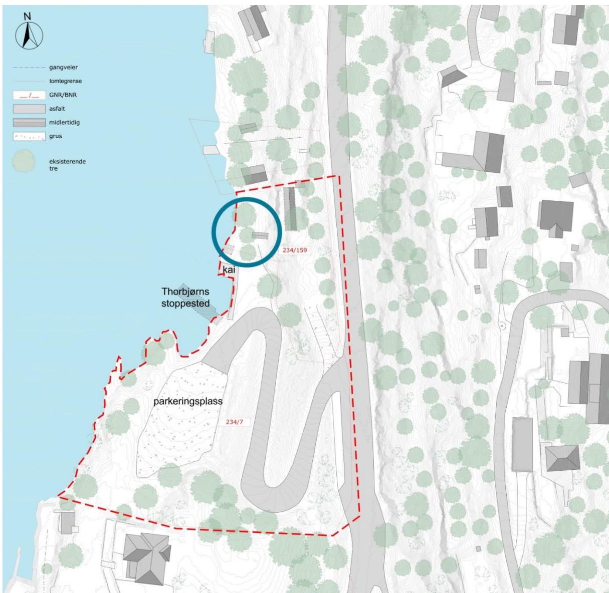
Figur 1: Kart som viser dagens situasjon. Minnesteidets plassering på tomten er markert med sirkel. Figur: Blakstad Haffner Arkitekter AS

Oppdraget gjelder utforming av minnesteidet, og tilhørende omgivelser. Utformingen skal gi et verdig og nasjonalt minnesteid med kunstneriske kvaliteter. Det skal være et sted for refleksjon for etterlatte, overlevende, frivillige, hjelpemannskaper samt nåværende og fremtidige generasjoner. Det har vært gjennomført en studie av tre mulige plasseringer av minnesteidet ved Utøyakaia, og endelig plassering er besluttet. Selve minnesteidets plassering er vist med blå sirkel i kartskissen under.