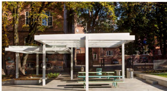
Parken byr på fleksible arealer med møbلمent for opphold, enten det er med familien eller vennefolkene.

oppfatt av, til ettertanke og inspirasjon for andre skolegårder i urbane strøk. Denne typen anlegg kan i større grad gi noe tilbake til byen.