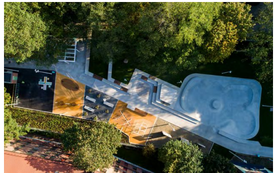
Ophold, ferdsel og aktivitet i en oversiktig og tydelig utforming. Mye har fått plass på lite areal i denne parken.

Vaskeekte urbant. Uterommene ved Lakkegata skole trengte mer enn en anskaffelse. Det har de nå fått ved et gjennomtenkt anlegg, der det som er overført til tilfeldehelene også er tilrettelagt for de spontane møtene, mylderet, leken. I stedet for å bygge gjerdet, har man fjernet dem. Det fungerer fordi dette anlegget blir mye mer enn en skolegårdsvidelse. Og nettopp dette var både oppdragsgjver og byggherrens