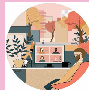
Studentkonkurransen "Nærmiljø".