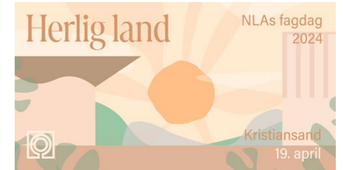
↑ Grafikk for fagdagen utarbeidet av Ruben Ratkusic.