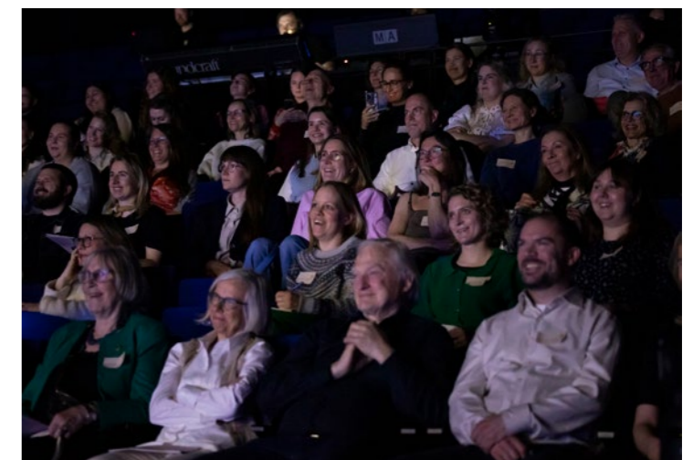
↑ Smilende publikum i salen på Kilden.