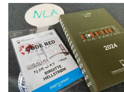
↑ Store mengder sakspapirer å sette seg inn i til IFLA World.