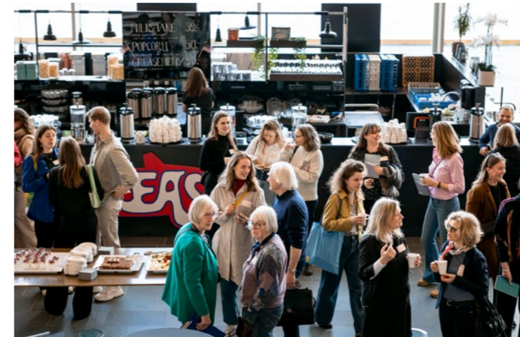
↑ Hyggelig stemning også i pausene på fagdagen.