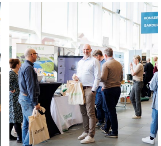
↑ Mingling rundt de flotte utstillene.