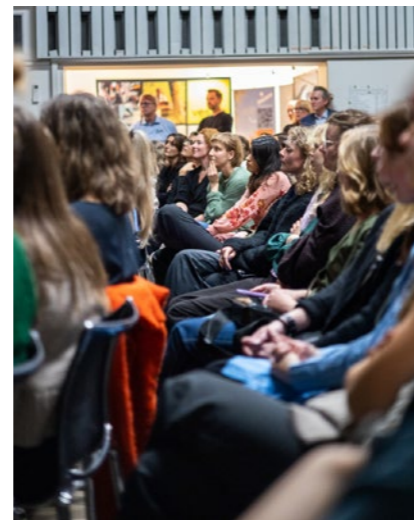
↑ Fullt hus i Arkitektenes Hus og flere på venteliste for å være med på LA-dagen.