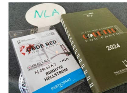
↑ Store mengder sakspapirer å sette seg inn i til IFLA World.