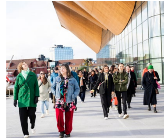
↑ Byvandring etter fagdagen i Kristiansand.

Foredragsholderne var invitert for å gi oss en faglig vitamininnspøyning, og minne om hvilke håp og muligheter som ligger i landskapsarkitekturen. Innleggene gikk fra vårt grunnleggende behov for natur, til utformingen av de gode møtstedene og til globale utfordringer. Vi fikk blant annet