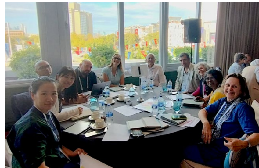
↑ President Birgitte Hellstrøm under IFLA World i Istanbul, sammen med landskapsarkitekter fra hele verden.

Under tittelen «Code red for earth» møttes landskapsarkitekter fra hele verden i Istanbul i Tyrkia første uka i september. 2.–3. september var det World Council, hvor delegater fra mange av de 80 nasjonale organisasjonene deltok sammen med representanter fra IFLAs komiteer og inviterte