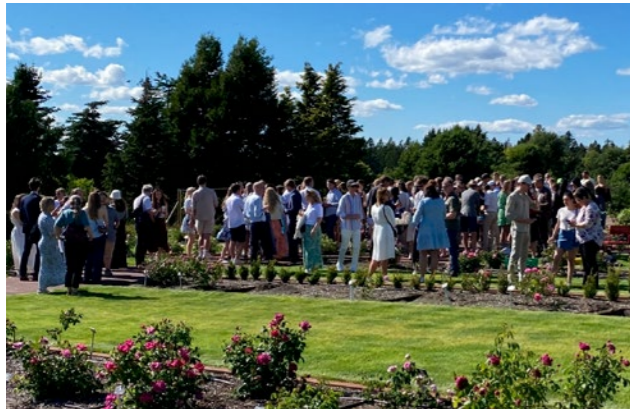
↑ Etter mange presentasjoner og løsninger på problemkomplekser, ble Gradsdagen 20. juni avsluttet i Rosariet på NMBU.