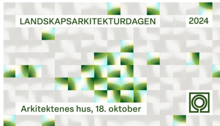
↑ Grafikk for Landskapsarkitekturdagen, utarbeidet av Ruben Ratkusic.