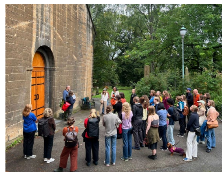
↑ NLA Oslo og Akershus 4. september: Gravlundsbeifering og sommerfest på Arkitektenes hus.