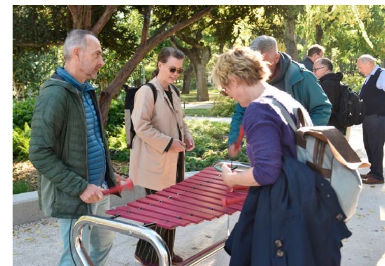
↑ IFLA Europas konferanse i Budapest omfattet også mange parkvandring. Xylofon som parkmøbel i Budapest.