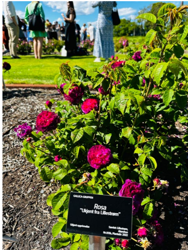
↑ Klonarkivet for roser består av funnroser fra hele landet, samlet inn av MNLA Unni Dahl Grue (1940–2015) på 1990- og 2000-tallet.