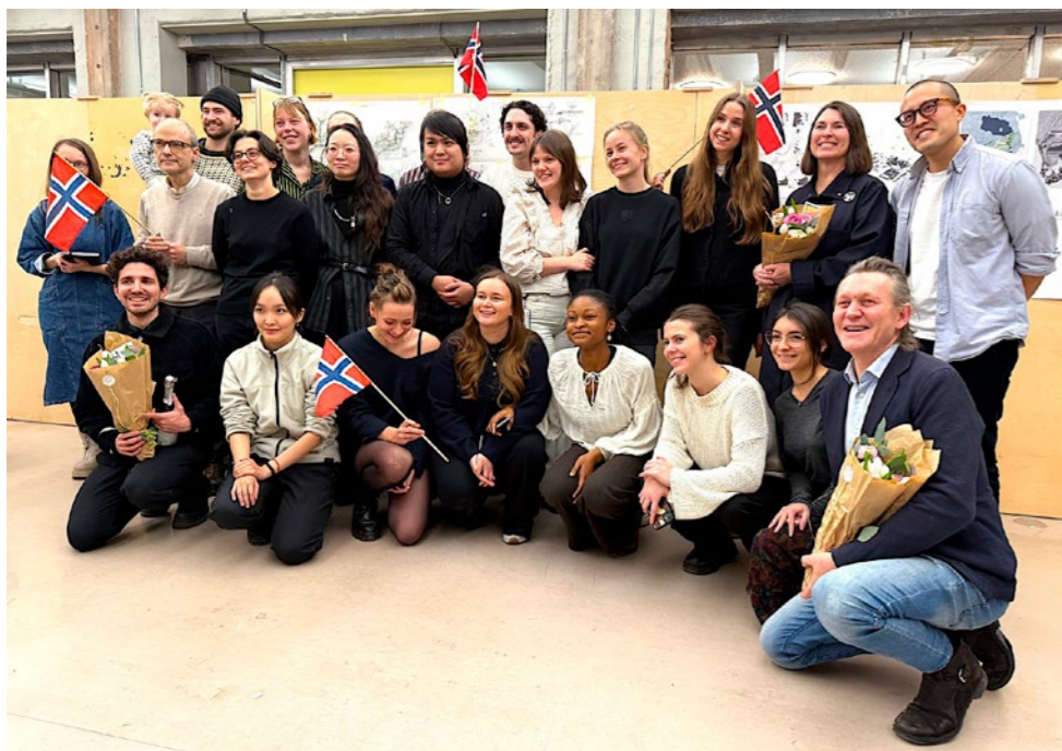
← Kurs for de internasjonale masterstudentene på AHO «Edge landscape» med case studie fra Rødtvedt i Oslo.

gjester. Det var to intense dager med gruppearbeid og diskusjoner om IFLA som organisasjon, og innlegg fra aktører og organisasjoner som det er aktuelt for IFLA å samarbeide mer med, blant annet UNEP (United Nations Environment Programme), UN habitat og WHO (World Health Organization).