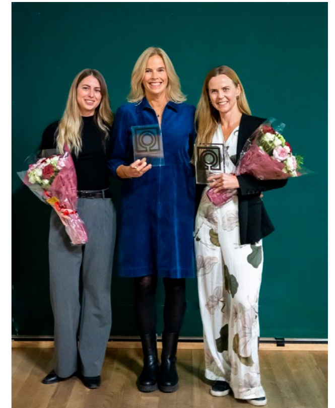
↑ Vinnerne av Landskapsarkitekturprisen 2024: Østengen & Bergo og oppdragsgiver Turistvegseksjonen ved Statens Vegvesen.