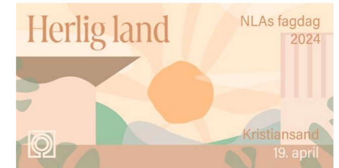
↑ Grafikk for fagdagen utarbeidet av Ruben Ratkusic.