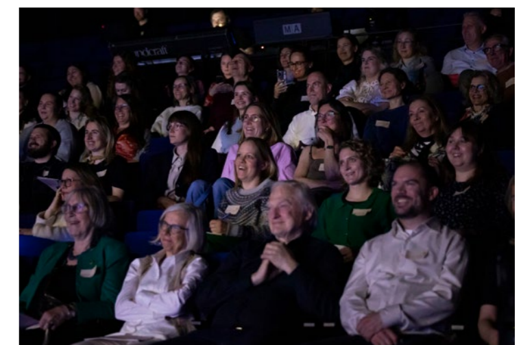
↑ Smilende publikum i salen på Kilden.