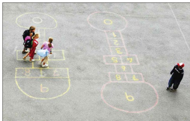
Det mangler natur i norske skolegårder. Det er ikke så rart om naturen får mindre verdi for våre barn, når de vokser opp med asfalt, dresserte planer og gummigrusmat, skriver forfatterne av innlegget.