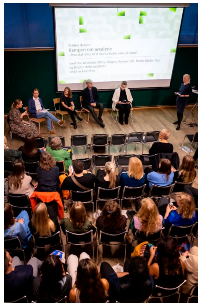
↑ Politisk debatt om hvordan vi forvalter arealene våre.