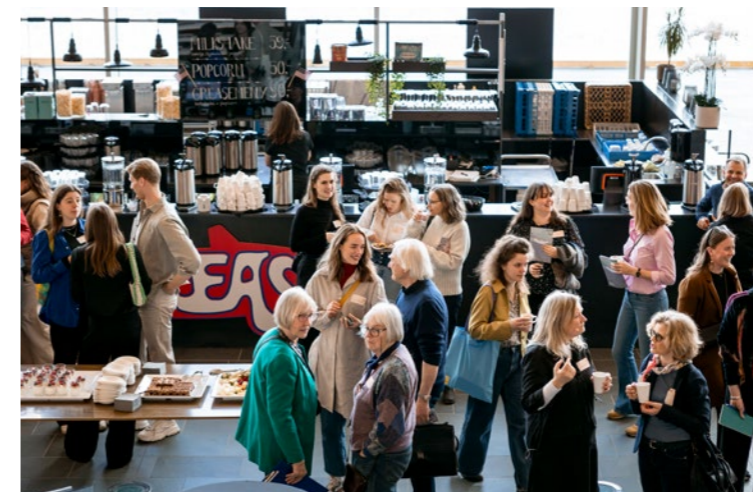
↑ Hyggelig stemning også i pausene på fagdagen.