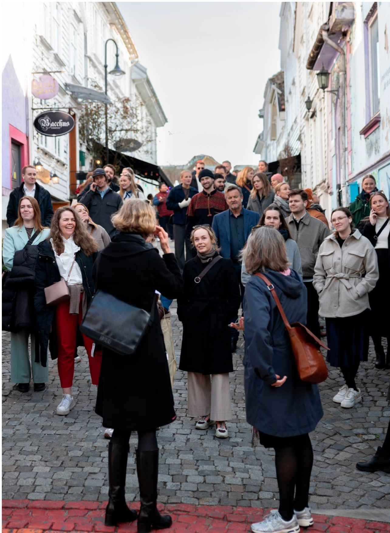
↑ Befaring under fagdagen om energilandskap i Stavanger.