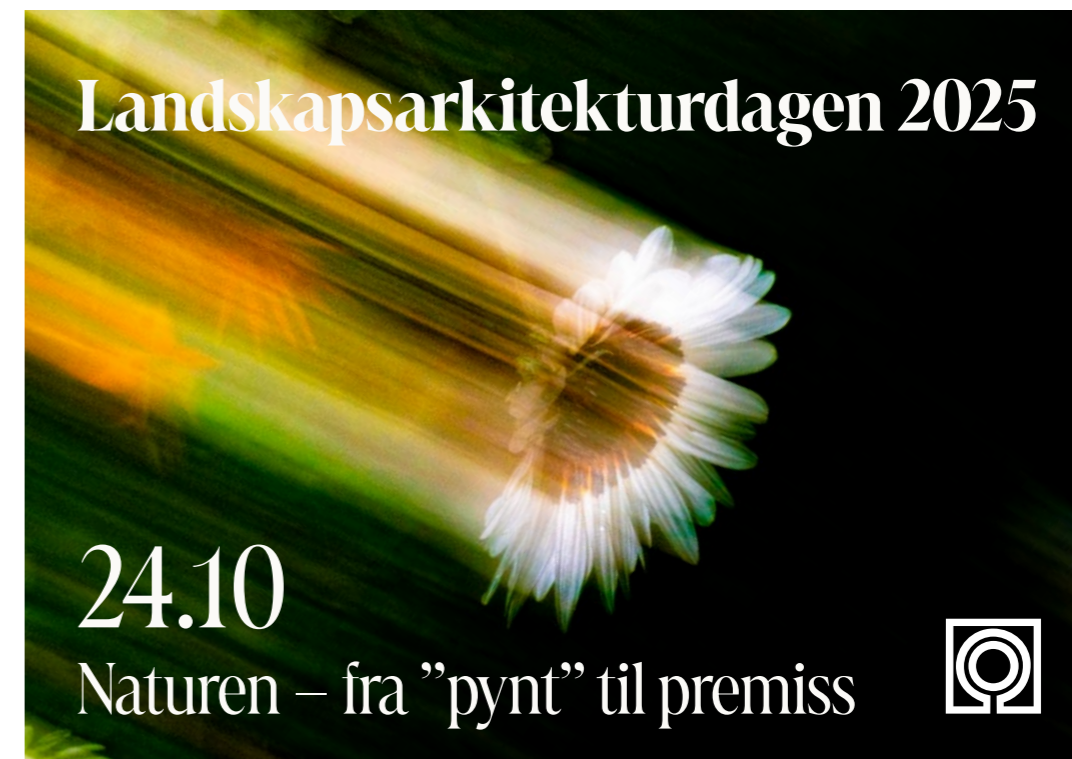
↑ Grafikk til Landskapsarkitekturdagen 2025, laget av Ruben Ratkusic.

Kurset ga en innføring i lokal overvannsdiskonering (LOD) med fokus på naturbaserte tiltak som grønne tak og regnbed. Deltakerne fikk presentert løsninger, fallgruver og suksesskriterier, samt erfaringer knyttet til dimensjonering, materialbruk og vegetasjon. Kurset ble sponset av Utomhus/Østfoldgress.