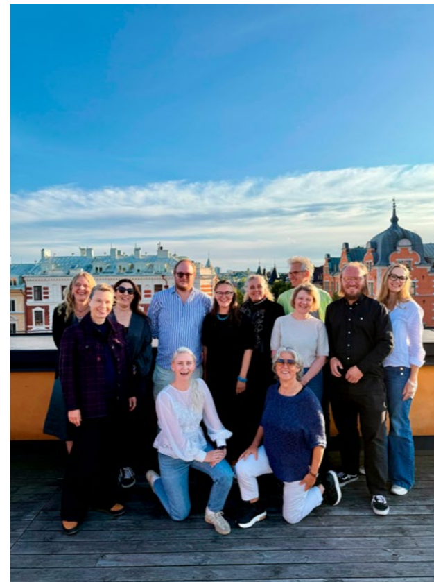
↑ Nordisk samarbeidsmøte i Stockholm.