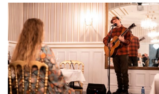
↑ Artisten Tønnes overrasket festmiddagdeltagere med humor og god musikk.