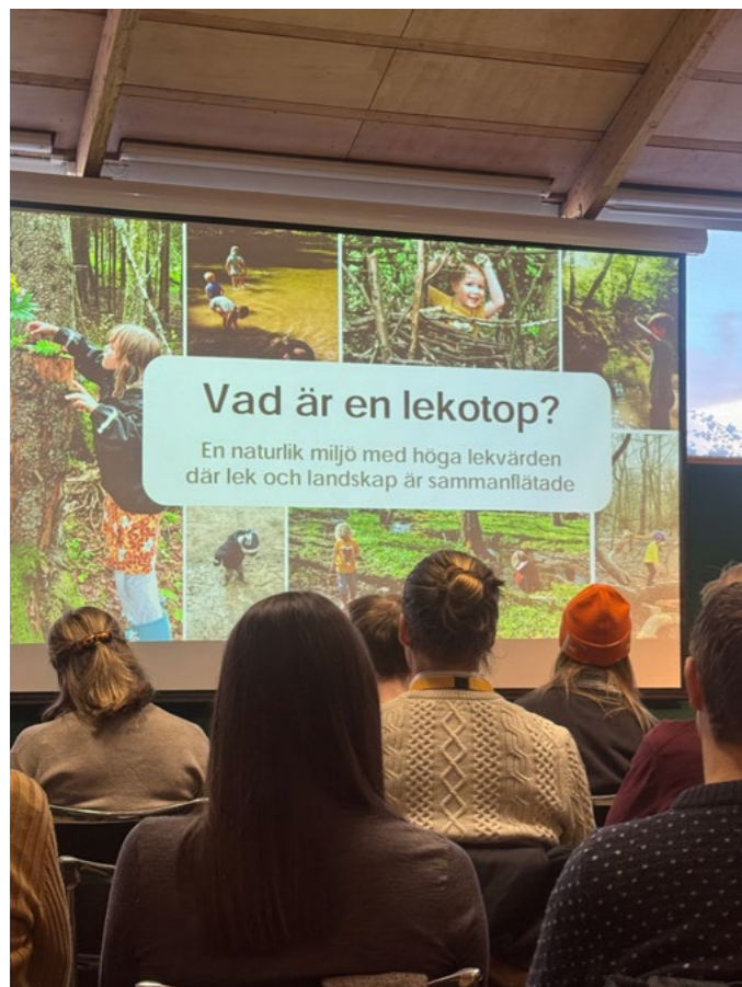
↑ Oppstartsseminar av prosjekt «Eksempel-samling for naturbaserte lekeplasser», med foredrag om lekotoper av Emma Simonsson, landskapsarkitekt i svenske Urbio.