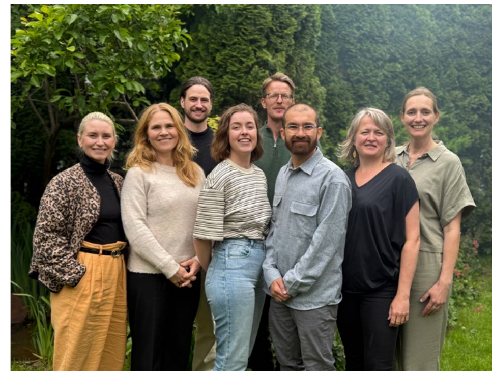
↑ Første styremøte etter årsmøtet. Studentrepresentant Victoria Schumacher mangler på bildet.

Samlet viser 2025 et styrket NLA – som tydelig samfunnsaktør, fagpolitisk stemme og profesjonelt fellesskap.