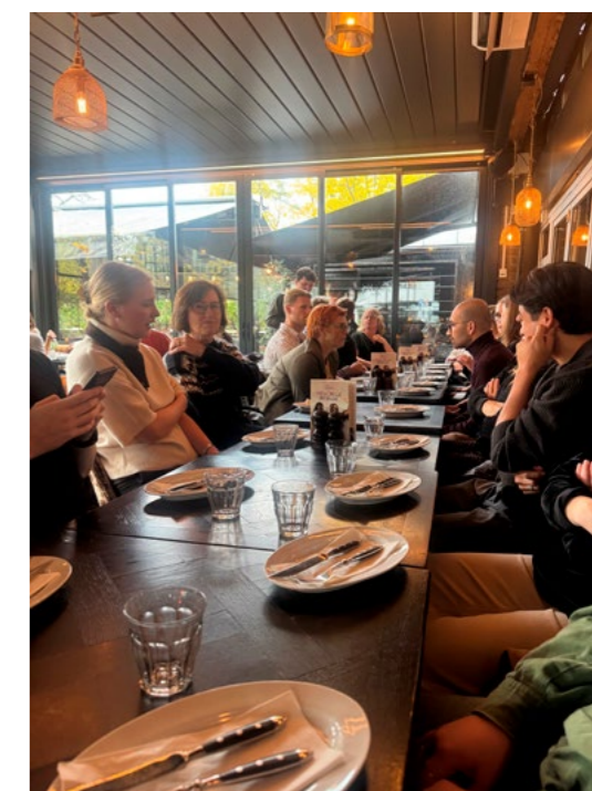
↑ Lunsj etter et alltid-fullspekket-KU-møte. Trivelig å møtes, men aldri nok tid.