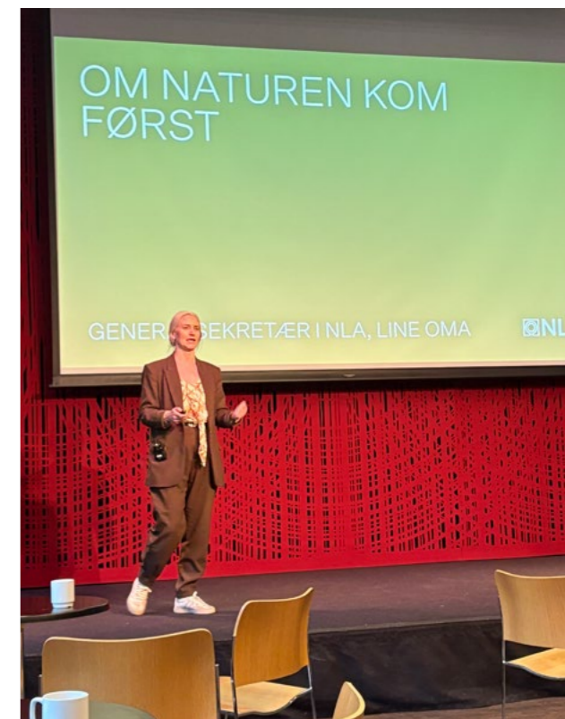
↑ GS Line Oma holder foredrag på Tekna-konferanse om naturmangfold.