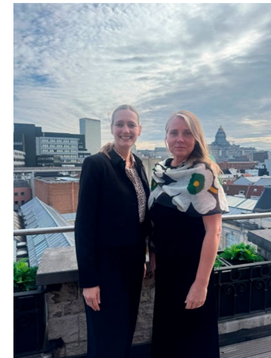
↑ President i NLA sammen med nyvalgt president i IFLA Europe, Indra Purs fra Latvia.