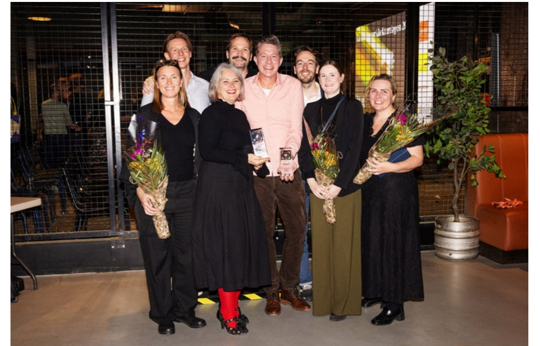
↑ Prisvinnere av Landskapsarkitekturprisen 2025 for Vollebekk torg.

Samlet sett har 2025 vært et år der NLA har markert seg tydelig i offentligheten. Gjennom strategiske medieutspill, faglige bidrag og aktiv deltakelse i samfunnsdebatten har organisasjonen styrket landskapsfagets synlighet og relevans – både i fagmiljøene og i den bredere politiske og offentlige samtalen.