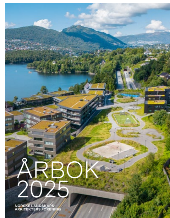
↑ NLA satte et stort bolig- og infrastrukturprosjekt på forsida av Årbok 2025 for å se på muligheter der formålet i utgangspunktet er vei. Skjoldnes park er utformet av Smedsvig landskapsarkitekter.