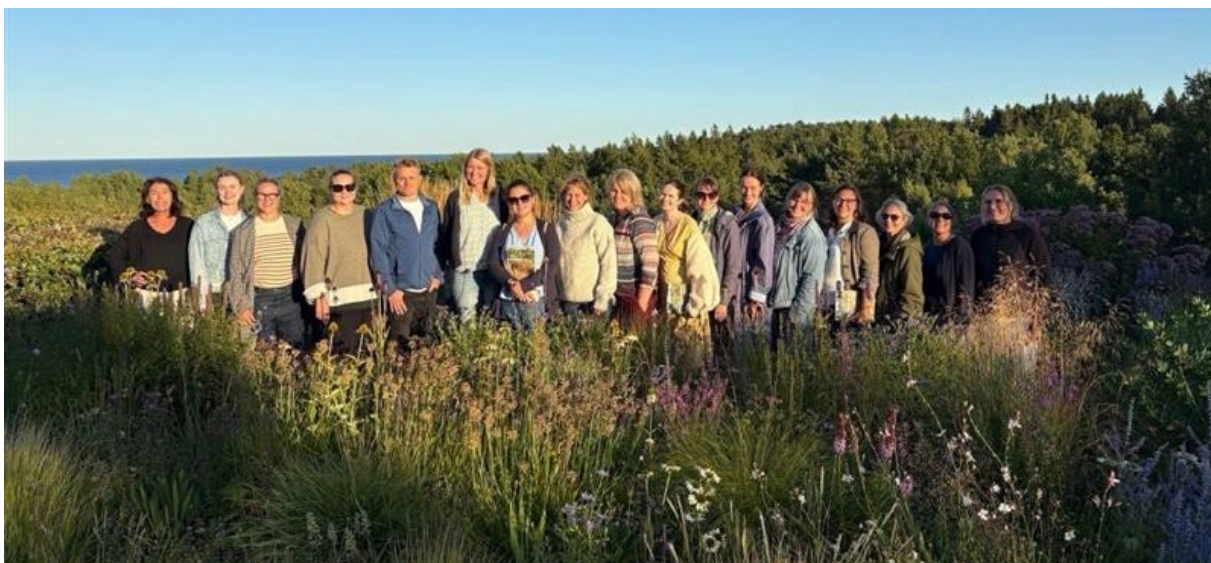
Bilde fra befaring til «Vill hageglede» i august.