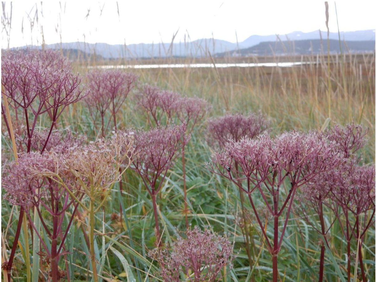
Bilde: Vendelrot ( Valeriana sambucifolia). Rørholmen, Alta.