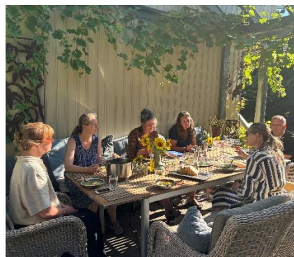
Medlemsmøte på Keims gård 22.5 og utvidet styremøte i Birgittes hage 18.8