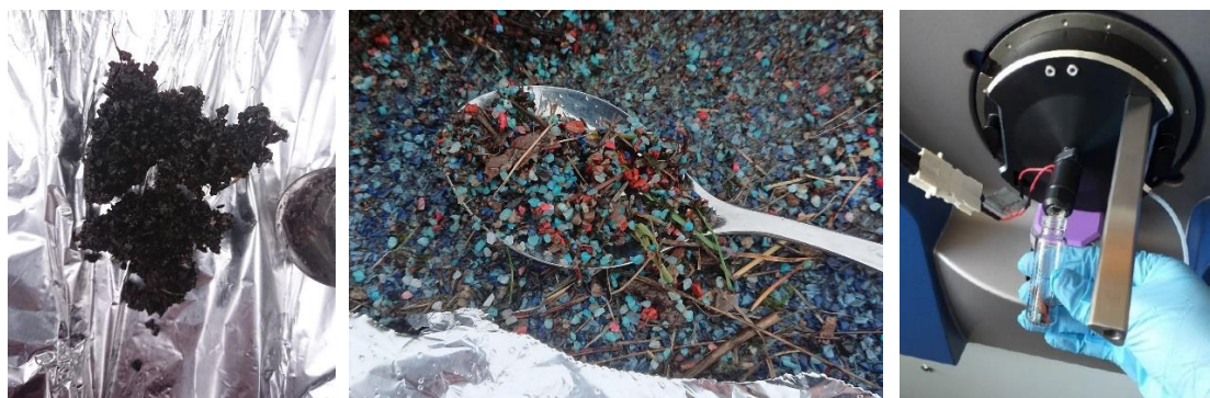
Bilder: eksempler på prøvemateriale, løse falldekkefragmenter lett tilgjengelig på utelekeområdene

Prøvetakingsprosedyre: prøvematerialet ble pakket direkte i to lag med aluminiumsfolie som så ble lagt i pose. Det ble på hver lokalitet samtidig tatt såkalte «blanke» referanseprøver der to lag med aluminiumsfolie uten prøvemateriale ble pakket, merket og oppbevart på samme måte som prøvene frem til analyse for å kunne skille ut eventuell kontaminering. Ved mottak hos NILU ble prøvene løsemiddelvasket så godt som mulig for jord, sand o.l. som ellers kunne forstyrret resultatene.