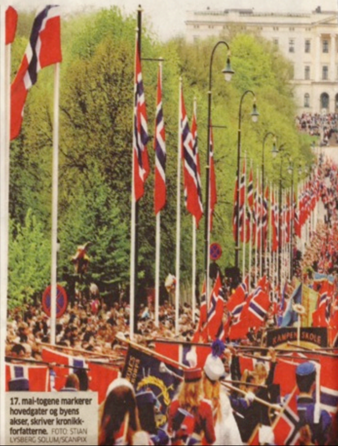
17. mai-togene markerer hovedgater og byens akser, skriver kronikkforfatterne.

Den amerikanske sosiologen Richard Sennett har definert byen som «det stedet der du møter den fremmede». Det er ute i det offentlige rommet vi møter de som er fremmede for oss, ansikt til ansikt. Invi-terende og inkluderende offentlige rom