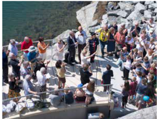
–10, 9, 8, 7, 6, 5, 4, 3, 2, 1 ooooooog der var stien åpnet!