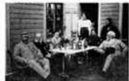
Lyststed og hageprakt