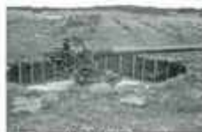
Kanontype II, 8 SKL 45 som ble plassert på Lyreneset