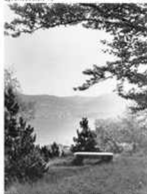
Utsiktpunktet mot byen, like ved flaggstanghaugen.