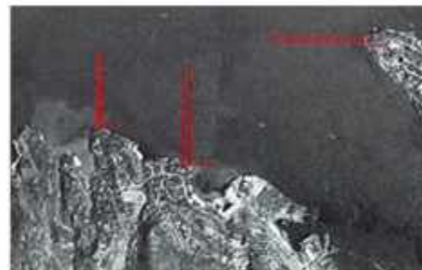
Under krigen var Lyreneset en del av den tyske marinens forsvarsverk, illustrasjonen viser sperrebatteriene på havnen, Lyreneset til venstre.

Paradoksalt nok blir huset keiseren så flittig besøkt, totalt adeltog under kampene mellom Norge og hans hjemland, 33 år etter hans siste besøk.