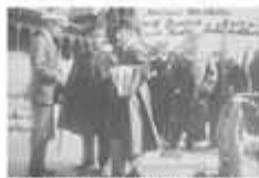
Keiser Wilhelm på Norgesbesøk