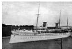
Hohenzollern, Keiserens skip.

I flere år valfartet den tyske keiser Wilhelm II på turer til Norge. Hver gang de kom inn i Puffefjorden i den vakre, hvite yachten "Hohenzollern", hadde han sett en familie oppe på et utkikkspunkt på styrbord side. De hadde flagget heiset, veivet med hvite lommestærker, vinket og ropt "Leve keiseren!" i kor. De har sittet i indiske stoler og flagget med tysk keiserflagg fra den flotte tomten, mens de har hilst skipet velkommen. Keiseren ble nyskjerm på hvem disse menneskene var og bestemte seg for å gjengjelde vilkommenheten, med et besøk, noe som ble fast tradisjon ved hans Bergesbesøk i mange år.