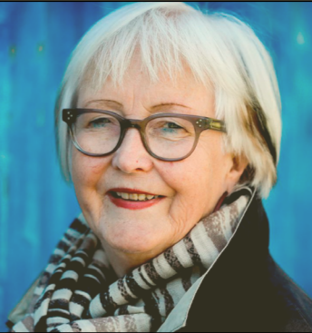
Ellen de Vibe