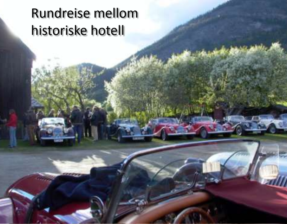
Rundreise mellom historiske hotell