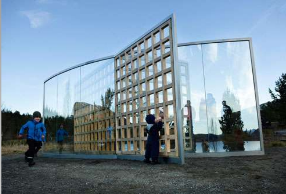
Vågå. Dan Graham (USA)