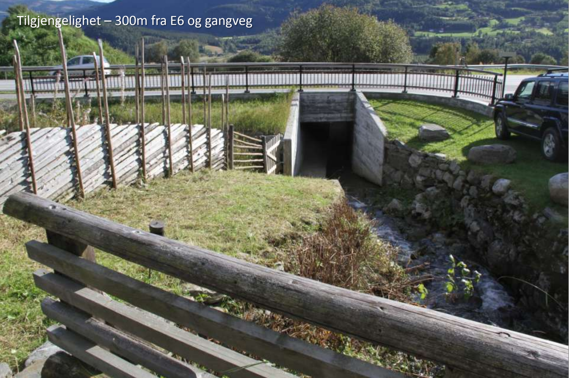
Gitte Dæhlins skulpturer «Flokk» på Sygard Grytting, Sør-Fron

Tilgjengelighet – 300m fra E6 og gangveg