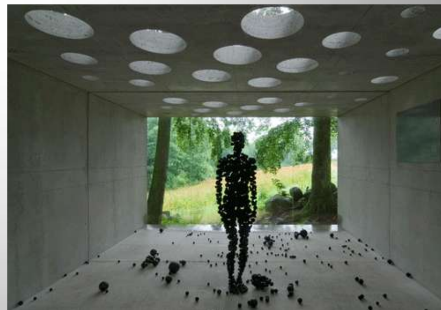
Lillehammer. Antony Gormley (Storbritannia)