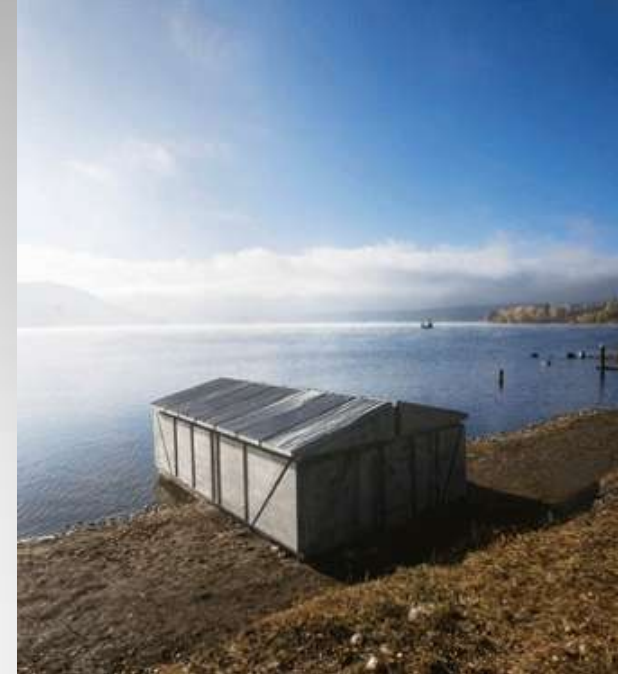
Gran. Rachel Whiteread (Storbritannia)