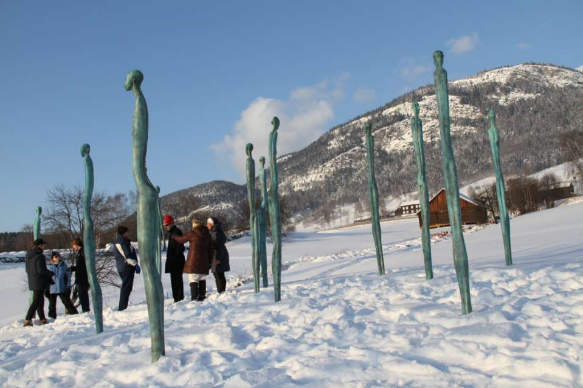
Gitte Dæhlins skulpturer «Flokk» på Sygard Grytting, Sør-Fron