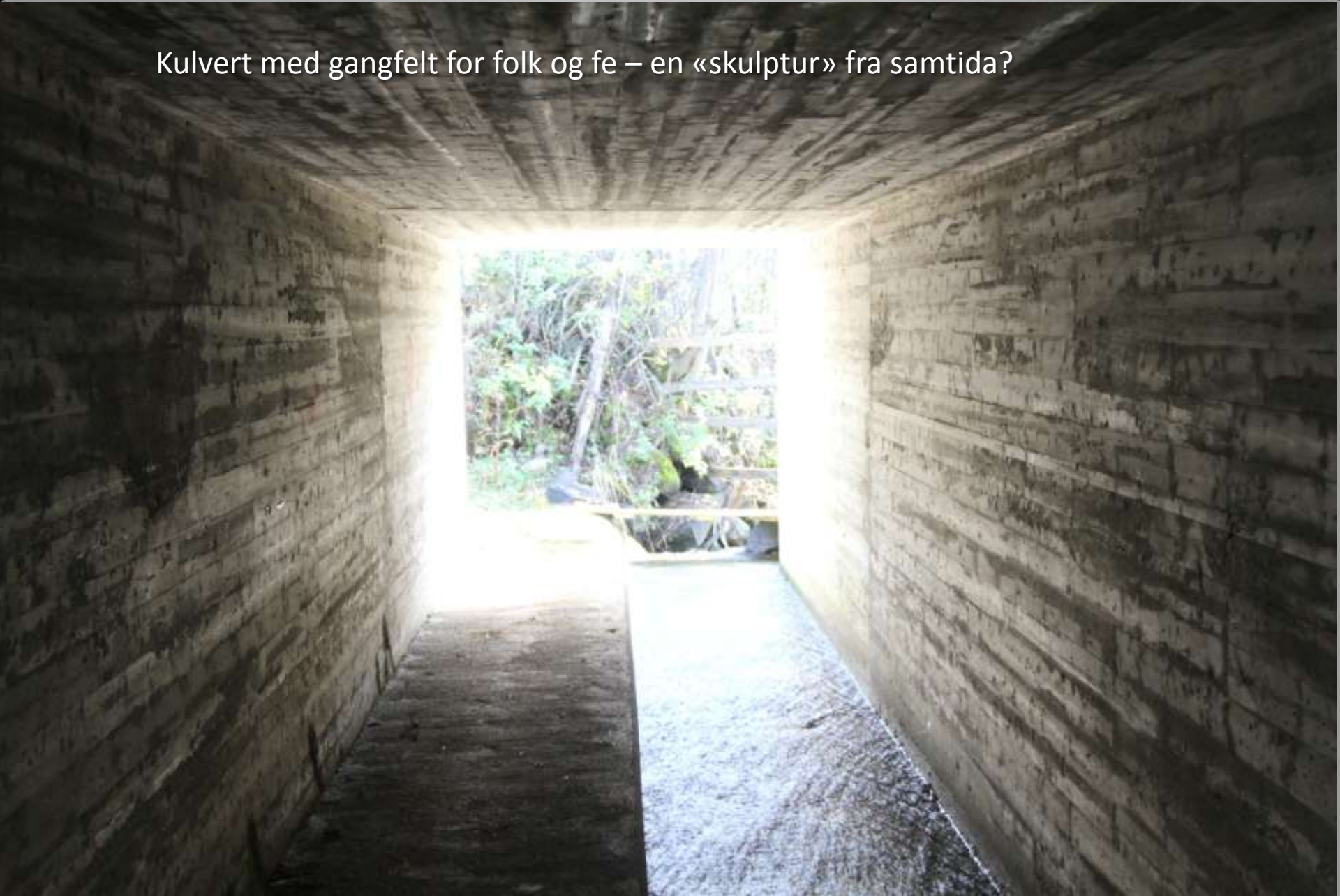
Gitte Dæhlins skulpturer «Flokk» på Sygard Grytting, Sør-Fron

Kulvert med gangfelt for folk og fe – en «skulptur» fra samtida?