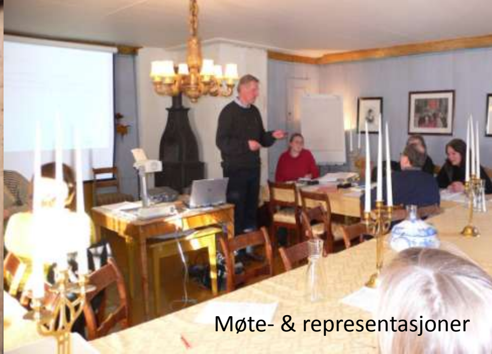
Møte- & representasjoner