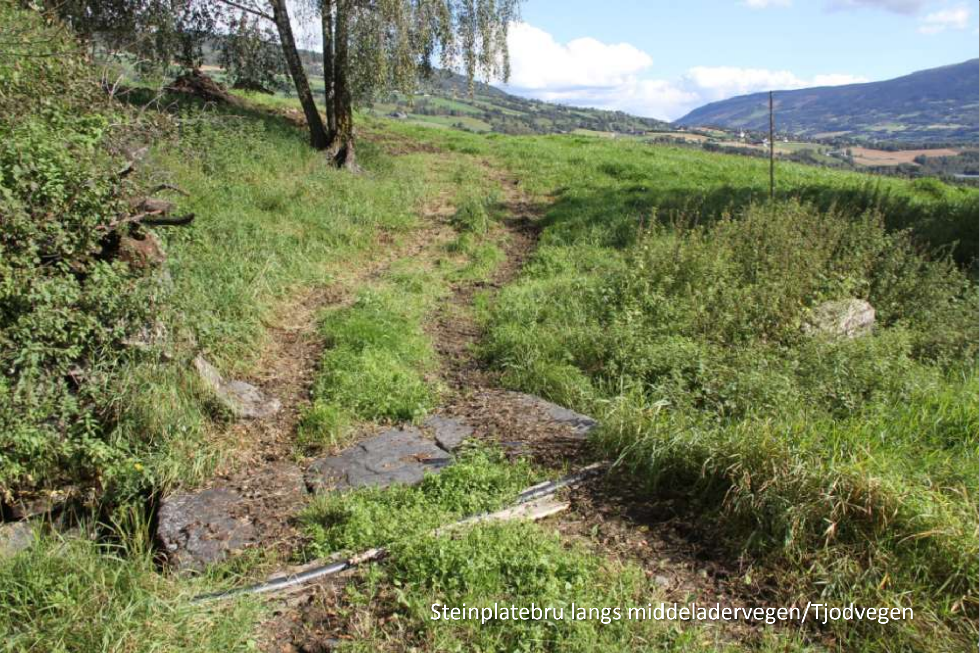
Steinplatebru langs middeladervegen/Tjodvegen