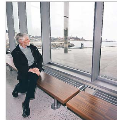
Viktig: Urbane kvaliteter som kultur er viktig for mange unges valg. Her i Belgens foaje.

- Det har noe med mennesker å gjøre, et miljø. Enda er det et stykke igjen til Larvik blir sånn at jeg har lyst til å flytte dit. Det må være plass til det litt smale også. Identitetsskapende nisjer mangler nå, flere grupperinger, mer variasjon.