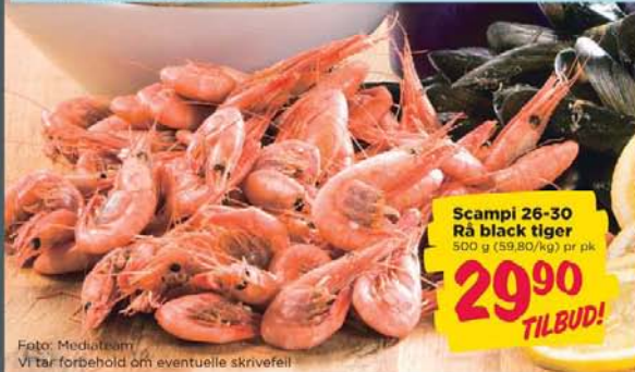
Vi tar forbehold om eventuelle skrivefeil

Tilbudene gjelder t.o.m. lørdag 24. april.