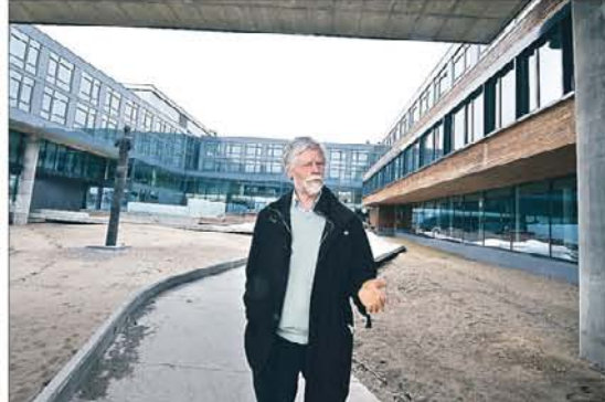
Dystert: Et spahotell helt i sjøkanten bør være lyst og innbylende, ikke mørkt og dystert, mener arkitektneestoren