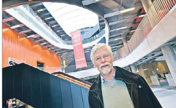
Dansk renhet: Storskolen har en industriell raffhet Butenschøn tror egner seg