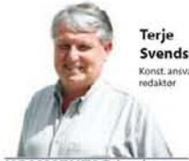
KOMMENTAR lørdag terje.svendsen@opno

Er det i hele tatt mulig å finne en løsning for en fullverdig dobbeltspors høyhastighetsbane gjennom Larvik, eller må vi nøye oss med en kvasiløsning og la banen ligge der den er, skriver konstituert ansvarlig redaktør Terje Svendsen i denne kommentaren.