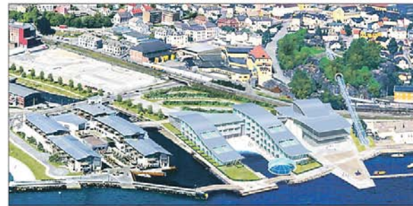
Rulletrapp: Det er også mulig å lage en rulletrapp i tube fra sentrum til Indre havn, denne fotomontasjen er laget av Ole Martin Raugland.