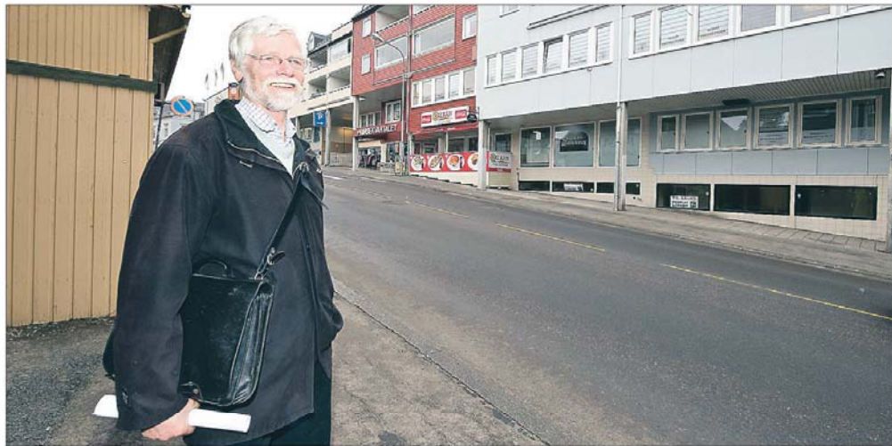
Ingen styring: Høyhus inntil en hovedgate vitner om dårlig planlegging. - Ingen styring og heller ingen formende vilje fra planleggerne, sier Butenschön.