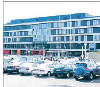
Thor Heyerdahl videregående skole