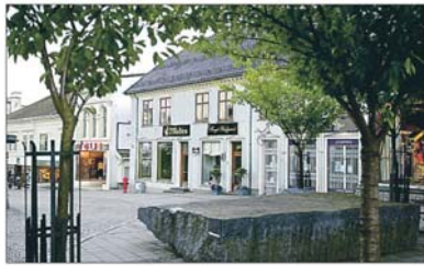
Ikke tilfeldig: Det er ikke tilfeldig at de gamle, vakre bygningene i Odberg gården er blitt stedet for nye restauranter.

Han mener den ekstreme forvandlingen i Indre havn var en genistrek av ordføreren.