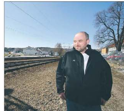
Fordele: – Jeg vil si at det er en fantastisk fordel med jernbanen i sentrum, sier