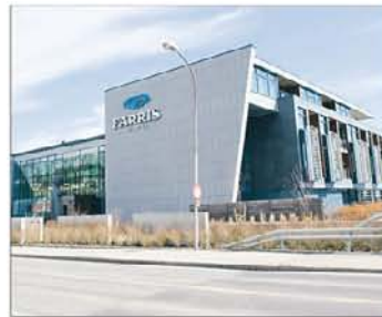
Farris Bad hotel

– Stakkars Thor Heyerdahl, han blir helt borte i bygget med hans navn.