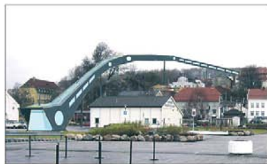
Trenger hjelp: Larvik By vil ha folks ideer om hvordan sentrum kan utvikles.