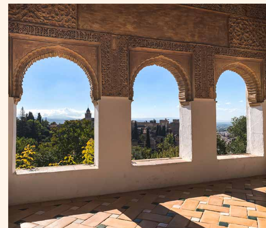
Utsikt mot Al-Hambra og Sierra Nevada.

status. I forbindelse med konferansen ble også IFLA Europes 38. generalforsamling avholdt i de staselige lokalene. Delegater fra 34 land, deriblant vår egen Yngvar Hegrenes, skulle samles rundt bordet. I tillegg til flere byråkratiske saker (som du skal slippe å få gjenfortalt her) ble det under møtet satt sterke følelser i sving i forbindelse med fysiske gjensyn, utdannings-spørsmål og undertegningen av Grana-