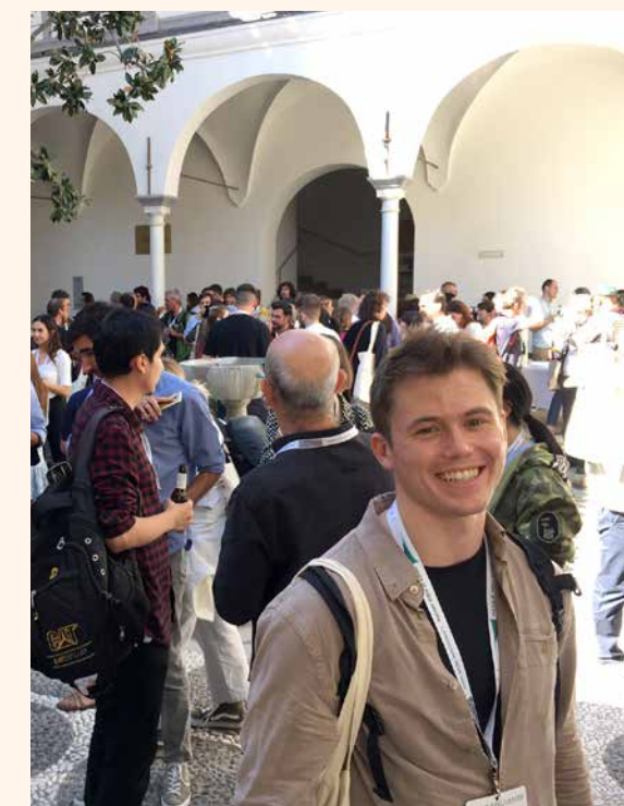
Lunsi i renessansepatioen på Escuela Técnica Superior de Arquitectura Granada.