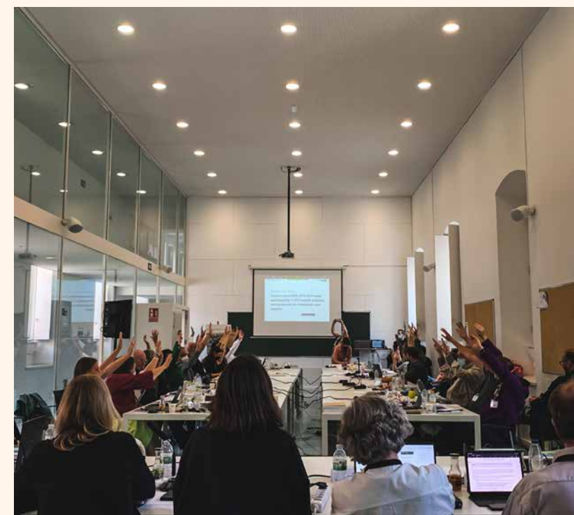
Fra IFLA Europes generalforsamling i lokalene til Technical School of Architecture, University of Granada.

IFLA er forumet der vi landskapsarkitekter koordinerer fagpolitisk på tvers av landegrenser, kulturer, styresett og sosioøkonomisk