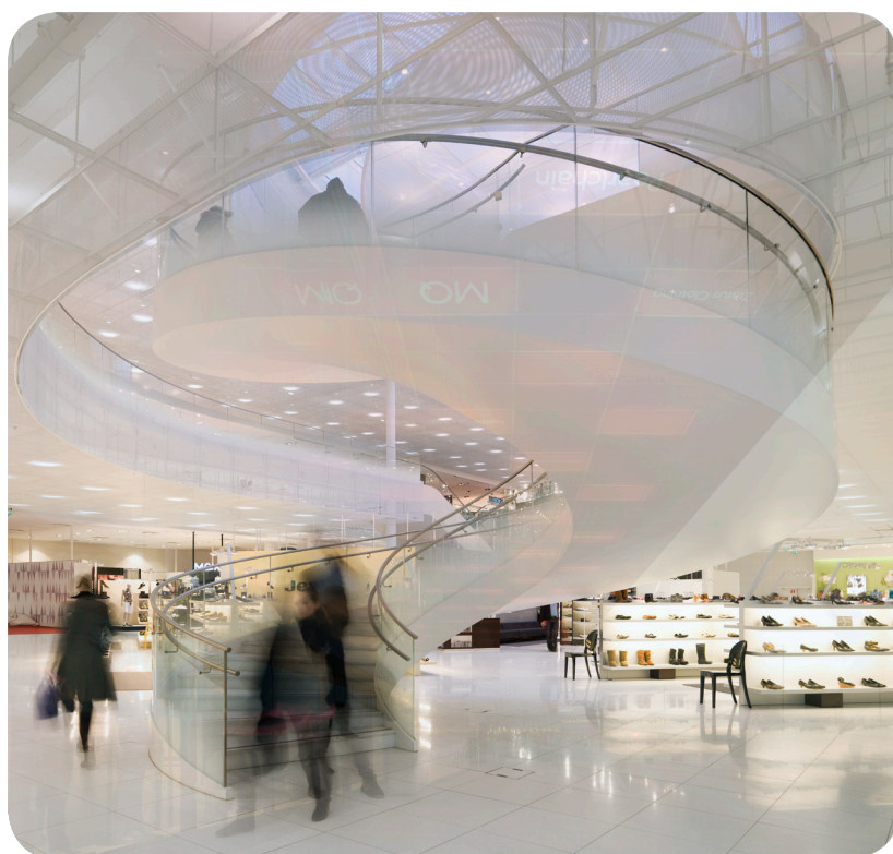
Gert Wingårdh har tegnet kjøpesenteret K:fem i Vällingby.