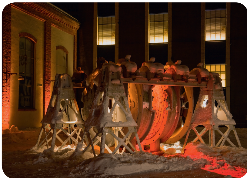
Fra PLDA workshop på Notodden.

Finn det ut på Lysdagen 2009, som blir årets belyningsbegivenhet, årets viktigste arrangement!