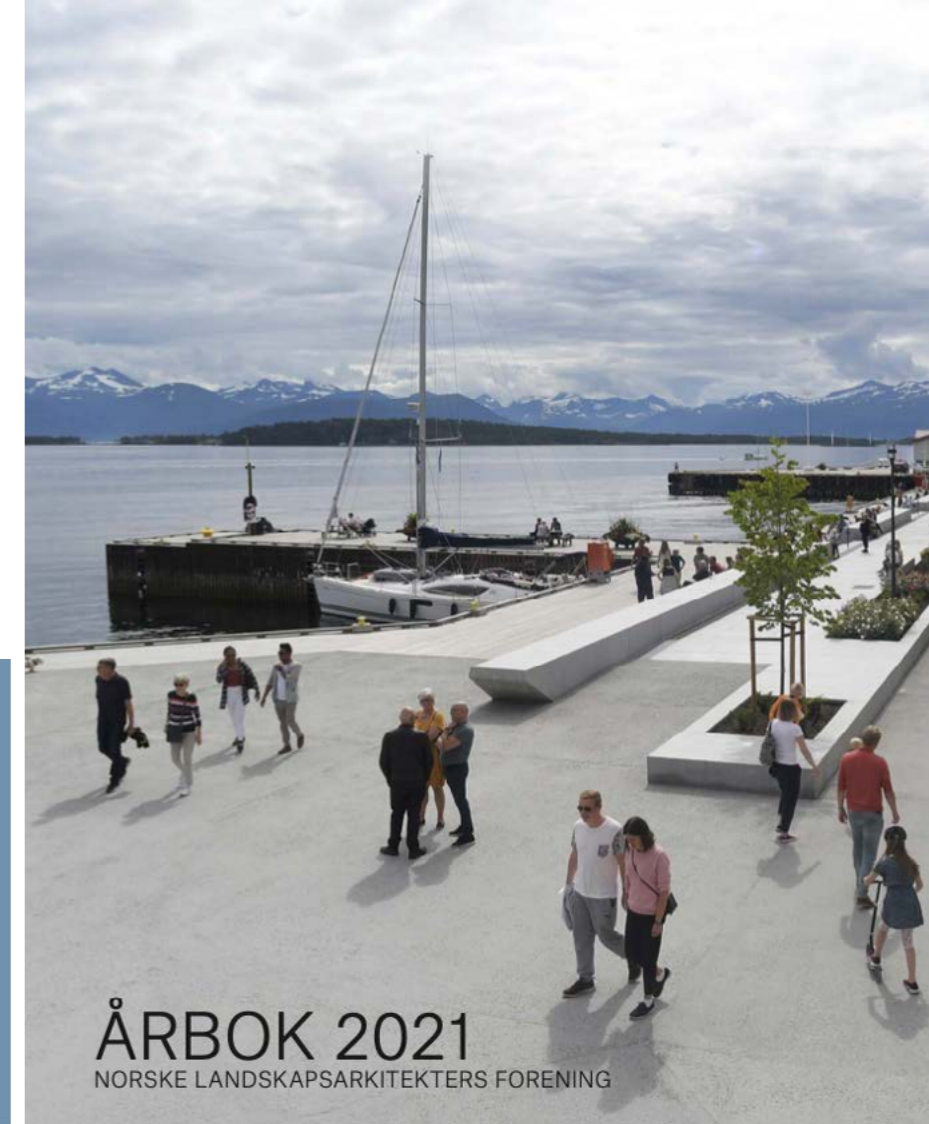
NLAAs årbok 2021, forsiden viser prosjekt Hamnegata, Molde sjøfront og torg – Norconsult AS, Ålesund/Molde og Molde kommune.

Forsiden til Felles arkitekturpolitisk plattform, arkitekturpolitikk.no – God arkitektur for et bedre samfunn. III.: DOGA.