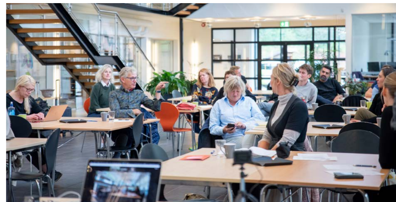
↑ Fra kontaktutvalgsmøtet 18.09 i kontorlokalene hos Norconsult i Larvik.