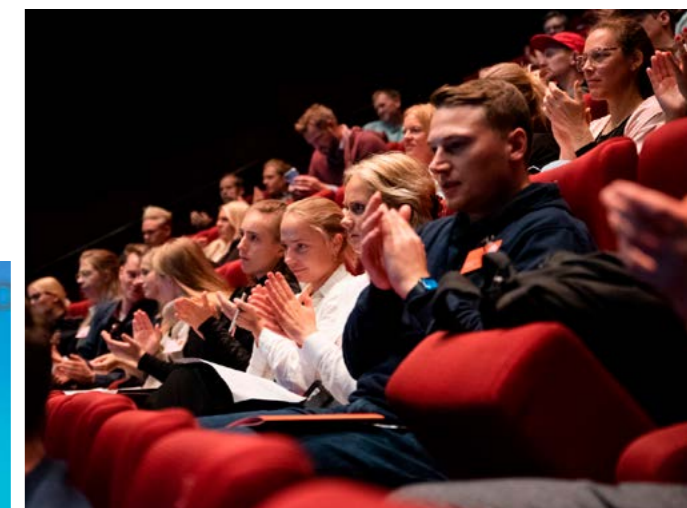
↑ Stemningsbilde fra salen.