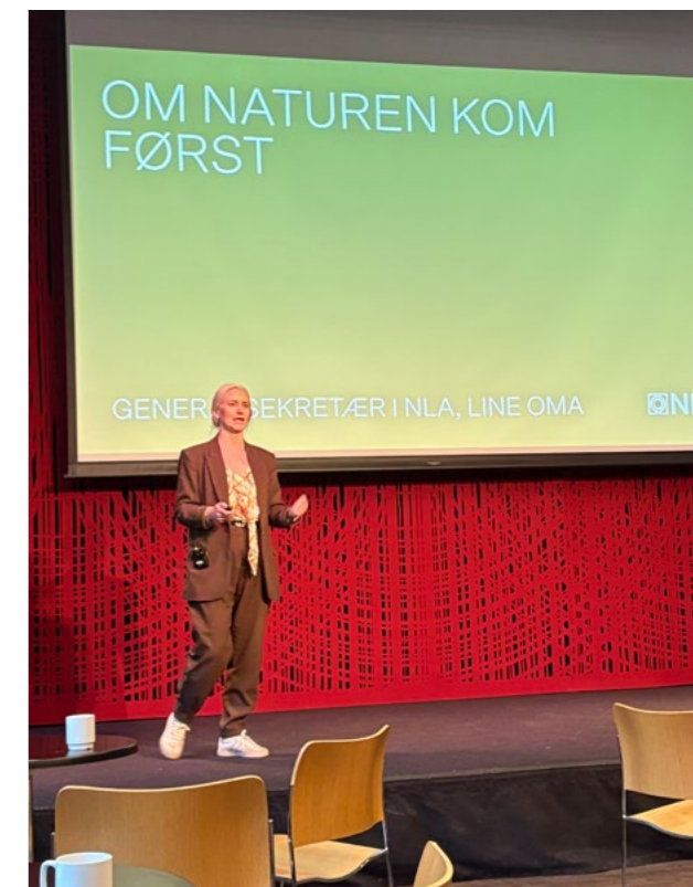
↑ GS Line Oma holder foredrag på Tekna-konferanse om naturmangfold.