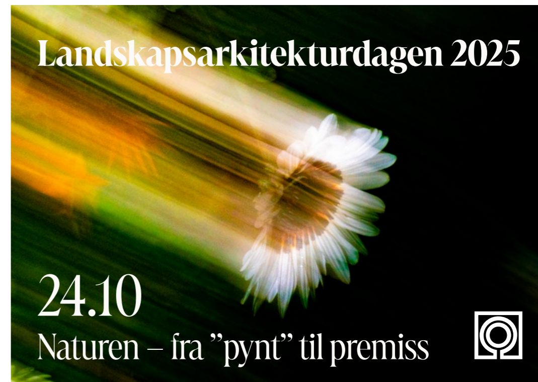
↑ Grafikk til Landskapsarkitekturdagen 2025, laget av Ruben Ratkusic.

Kurset ga en innføring i lokal overvannsdistribusjon (LOD) med fokus på naturbaserte tiltak som grønne tak og regnbed. Deltakerne fikk presentert løsninger, fallgruver og suksesskriterier, samt erfaringer knyttet til dimensjonering, materialbruk og vegetasjon. Kurset ble sponset av Utomhus/Østfoldgress.