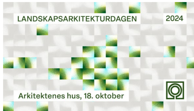
↑ Grafikk for Landskapsarkitekturdagen, utarbeidet av Ruben Ratkusic.