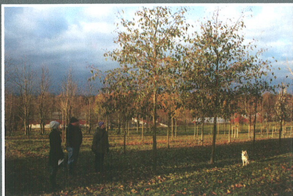
Trærne i forsøksparken er pedagogisk organisert og etikettert